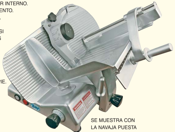
SE MUESTRA CON LA NAVAJA PUESTA